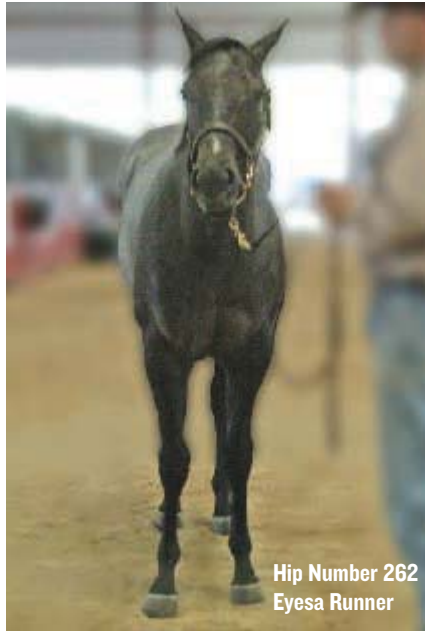
Hip Number 262 Eyesa Runner

RH: Este es un potro tremendamente bien criado. Verdaderamente bien criado. Me gustan sus hombros: uno puede ver por donde bajan desde la cruz hasta la punta de los codos. Su cruz se asienta atrás en el medio de su lomo. El podría ser un poco más fuerte en su cadera. Su cabeza se ve muy bien, tiene un cuello limpio y de buena contextura el cual se empata bien, y posee también una buena línea de vientre. Cuando se para, se ve un poco remetido en los miembros posteriores. Si pudiera repararlo, me gustaría que se moviera un poco hacia adelante en su cadera y que fuera un poco más fuerte en el área de los