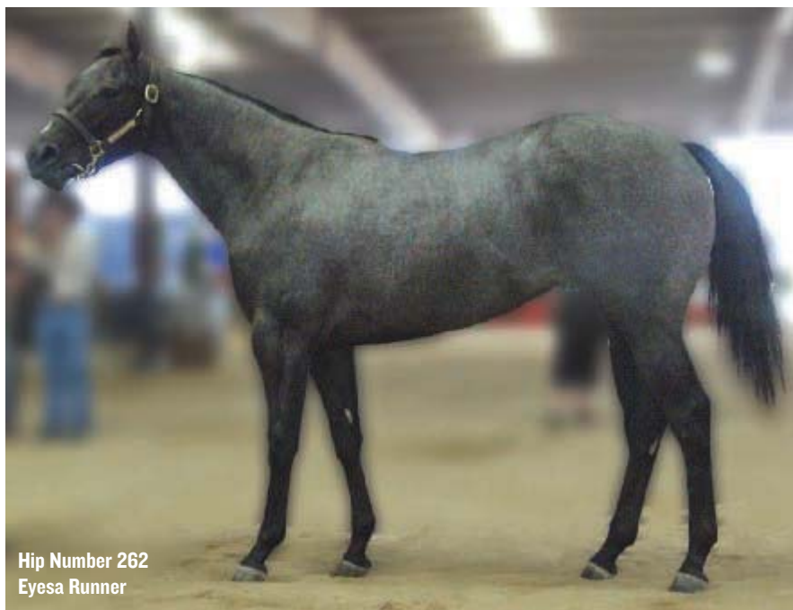
Hip Number 262 Eyesa Runner

Tesoro en Venta en el rango de precio bajo: “Uno lo que busca es por un atleta hijo de un semental joven, que no haya demostrado mucho pero que sin embargo se le vea que seguro tiene una oportunidad”. – Russell Harris